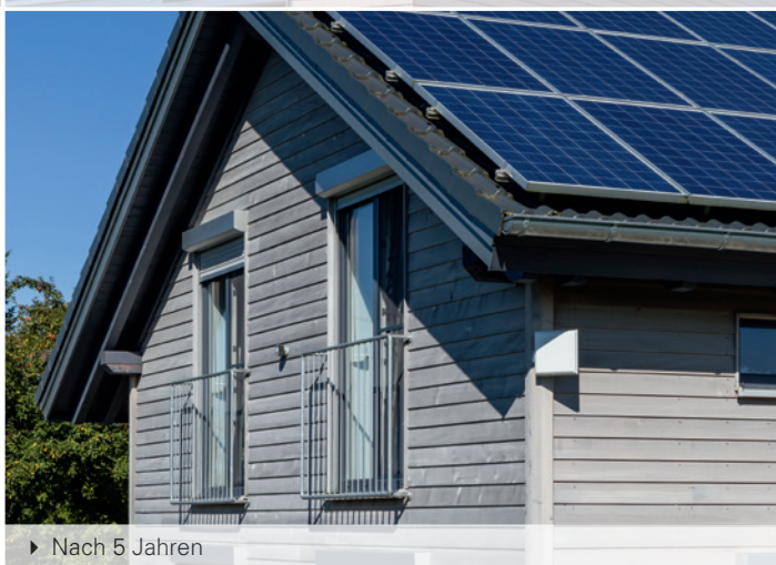
► Nach 5 Jahren