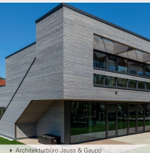
► Architekturbüro Jauss & Gaupp