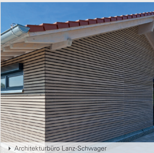
► Architekturbüro Lanz-Schwager