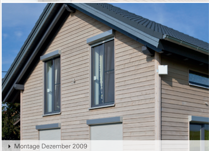
► Montage Dezember 2009