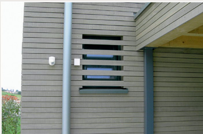
► Montage Juni 2009