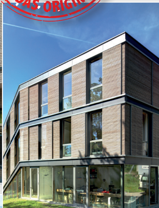
► Architekturbüro Lanz-Schwager