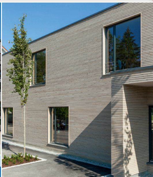
► Architekturbüro Haller