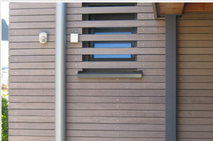
► Nach 5 Jahren