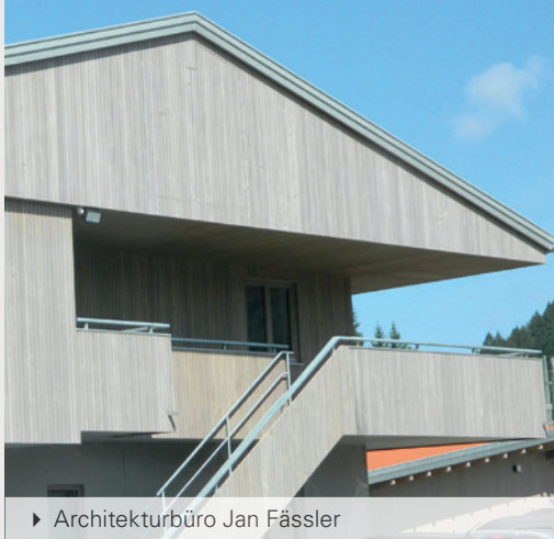
► Architekturbüro Jan Fässler

KEINE ANDERE VORVERGRAUTE HOLZFASSADE VERFÜGT ÜBER SO LANGJÄHRIGE ERFAHRUNG ! ÜBER 1.000.000 m 2 GEBEN UNS RECHT.